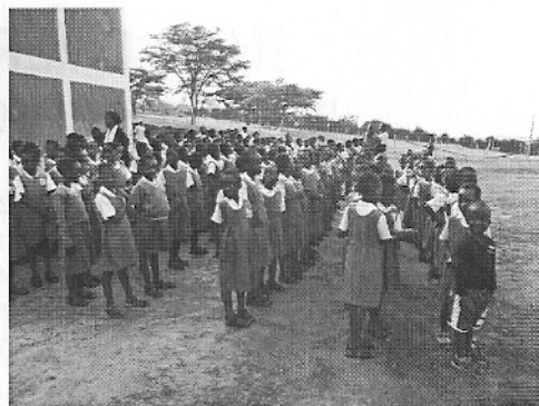
De schooldag begint met een samenkomst van alle leerlingen

Overigens komen medewerkers van de Stichting 'Friends of Coloma School' in de diverse groepen van onze school voorlichting geven over dit project.